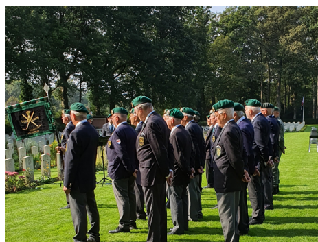
COV Gelderland keurig in het gelid

Tegen 17.00 uur nam men afscheid van elkaar en was het al met al een geslaagde middag.